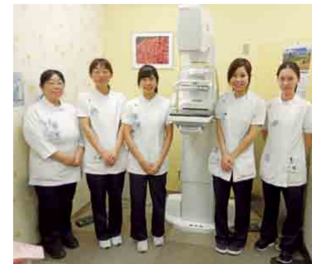
【私達が検査をさせていただきます!】

一人ひとりに多めの時間をとり、問診・触診、乳房X線撮影(マンモグラフィー)、乳腺超音波