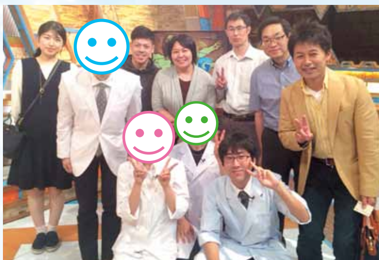
▲ドクターG撮影現場にて